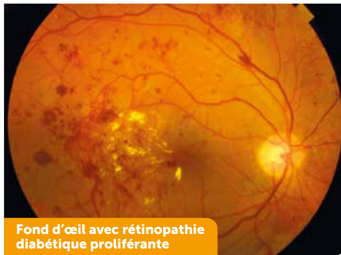
Fond d'œil avec rétinopathie diabétique proliférante

lecture pour une interprétation par des ophtalmologistes spécialisés en rétine. Le réseau OPHDIAT, particulièrement implanté en Île de France et piloté par le service d'ophtalmologie de Lariboisière, participe à ce dépistage à grande échelle.