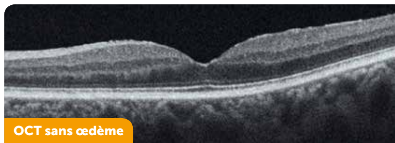
OCT sans œdème

Un dépistage précoce est donc essentiel !