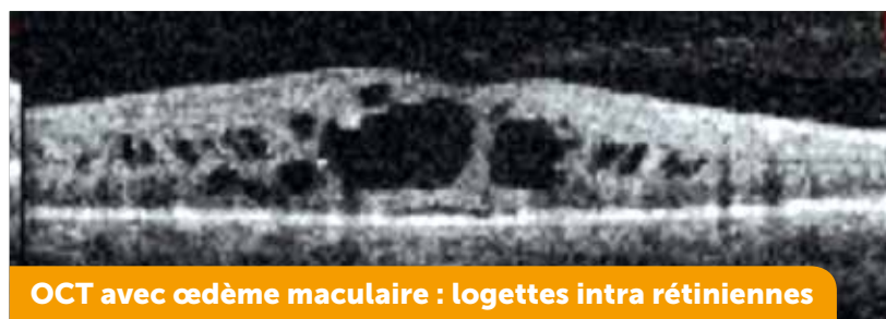
OCT avec œdème maculaire : logettes intra rétiniennes